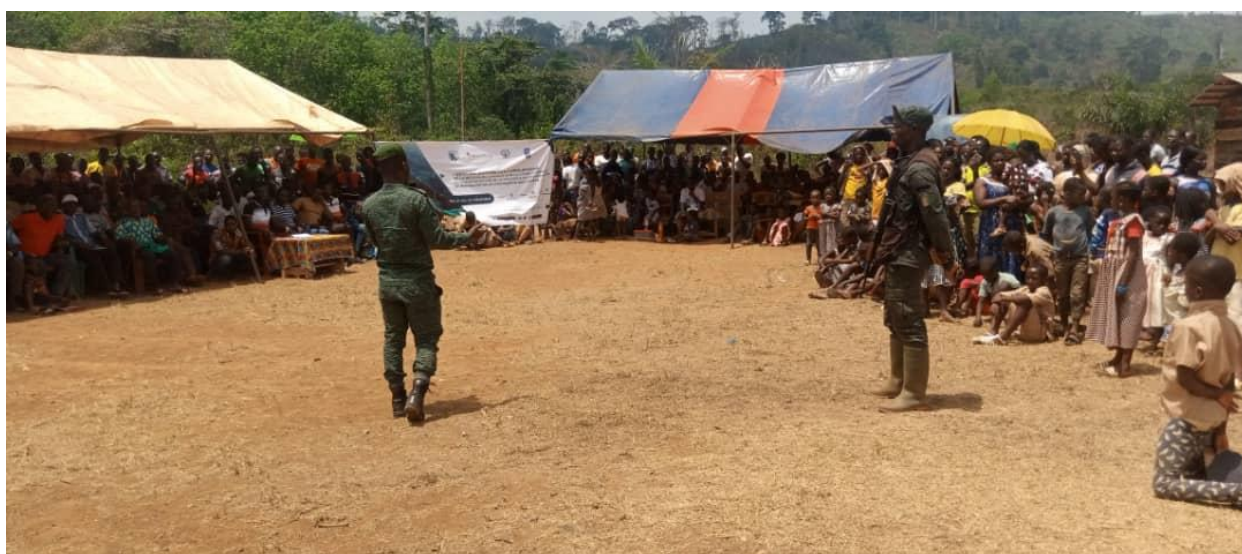
Figure 3: Explication de la politique forestière et du code forestier - Konankro, 24 février 2022

IDEF, au service des communautés et de la Forêt