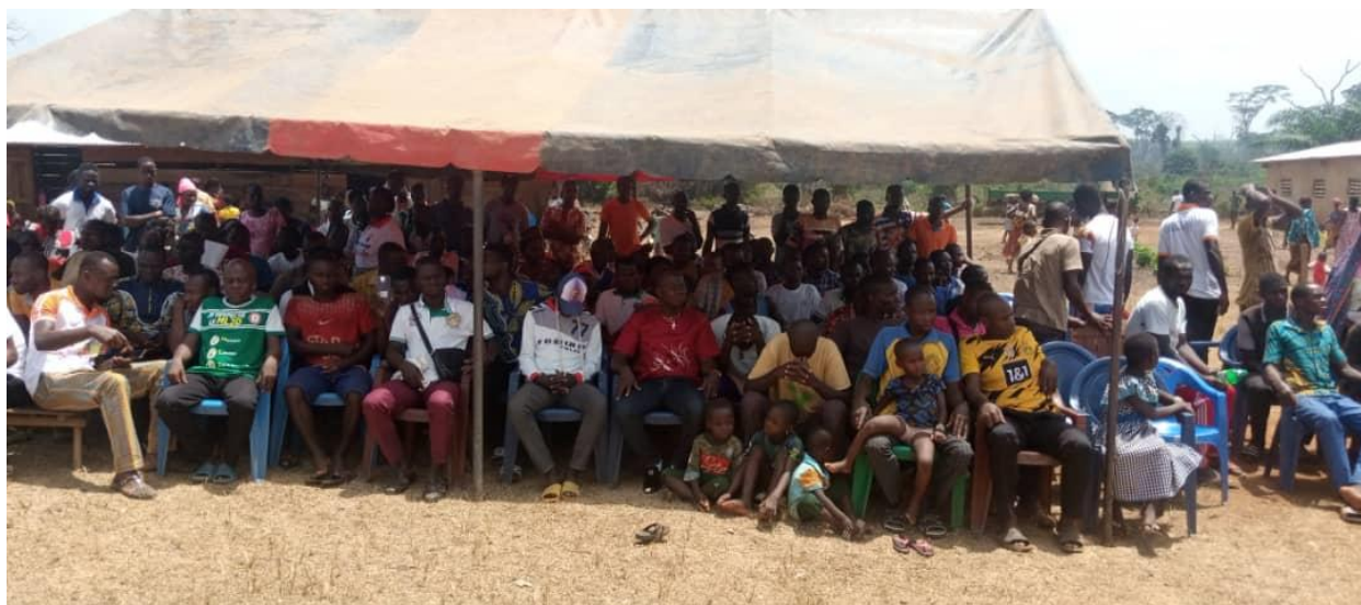
Figure 2: une vue des participants à la sensibilisation - Konankro, 24 février 2022