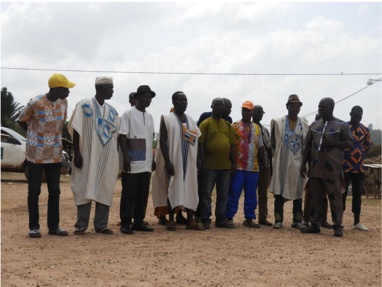
Figure 5: La libation par la chefferie pour l'ouverture de la sensibilisation - Béoué 23 février 2022