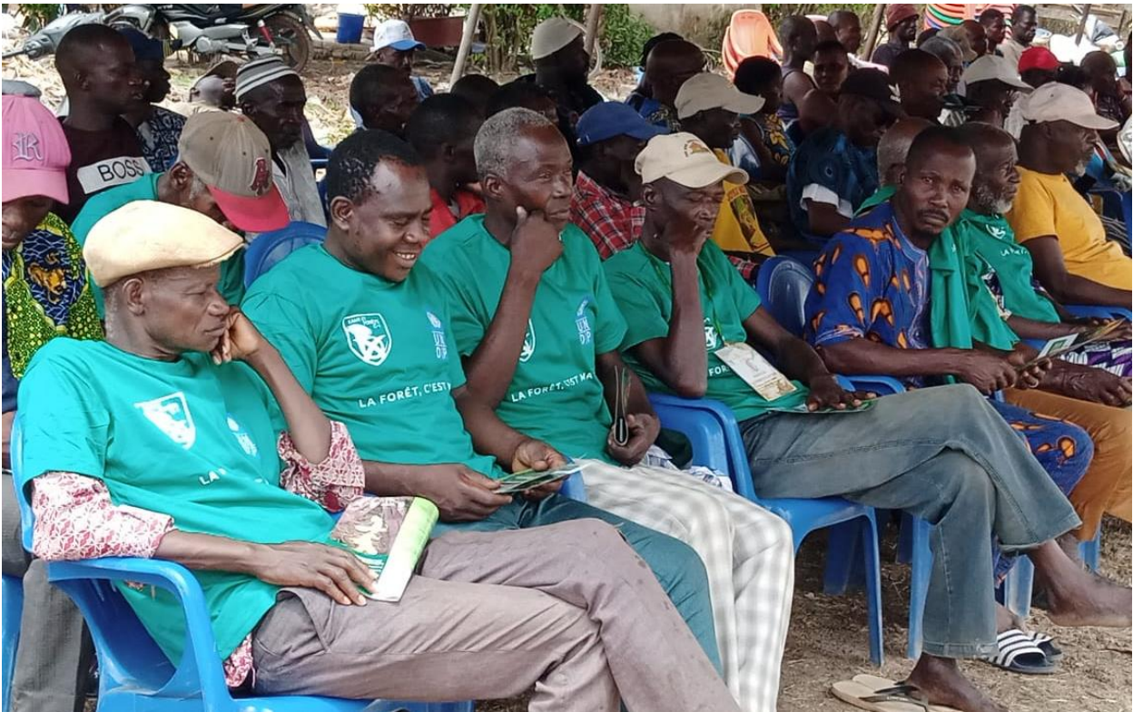
Figure 4: Une vue des participants à la sensibilisation - Zéaglo, 22 février 2022